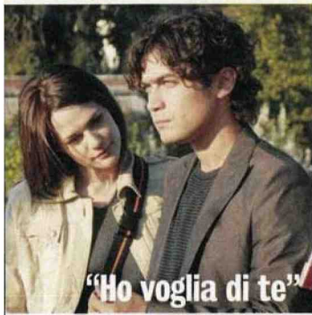
"Ho voglia di te"

Quando in particolare ha messo in pratica questo approccio alla vita? «Con Tre metri sopra il cielo per esempio. All'inizio le case editrici mi dicevano di no, attendevo mesi per avere un cenno e poi la risposta era più o meno questa: "Ma ti pare che si possa pubblicare una cosa del genere?". Alla fine me lo sono pubblicato da solo».