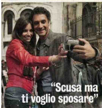
"Scusa ma ti voglio sposare"