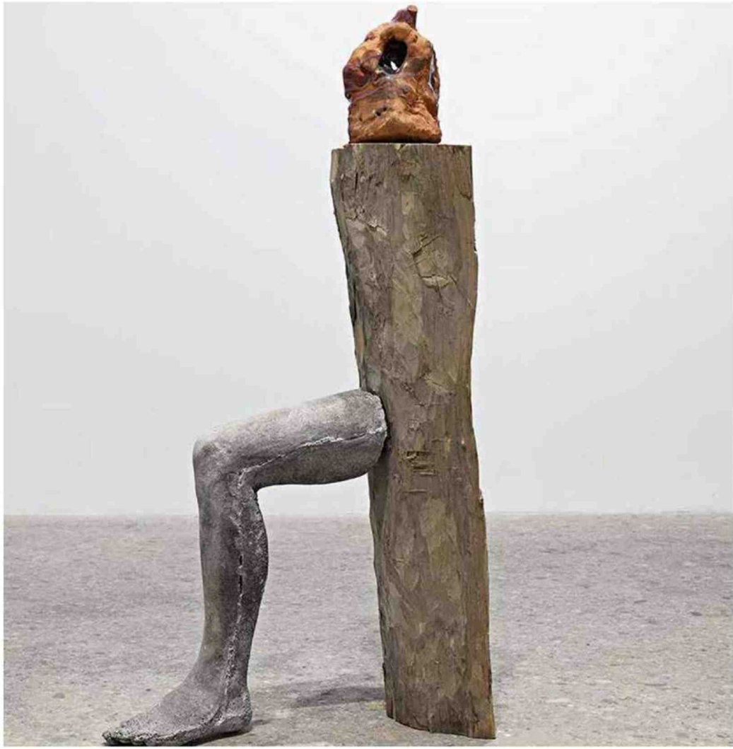
«New York Golem», 2017. Un'opera del gruppo austriaco Gelitin