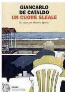
Un cuore sleale Giancarlo De Cataldo Einaudi, pagg. 244, euro 17