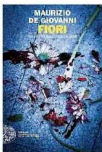
Fiori Maurizio de Giovanni Einaudi, pagg. 262, euro 18,50