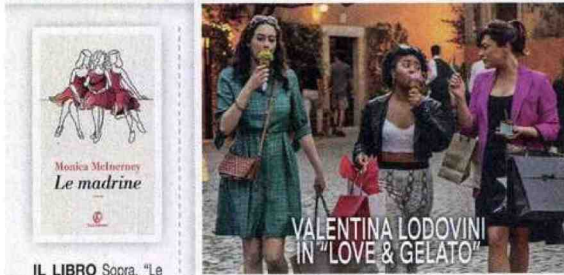
VALENTINA LODOVINI IN "LOVE & GELATO"