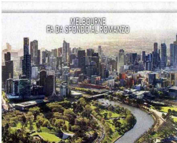
MELBOURNE FA DA SFONDO AL ROMANZO